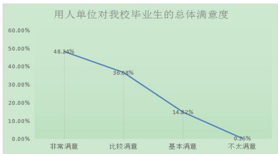
图2 用人单位对我校毕业生总体满意度

查，主要从单位基本情况、人才培养质量评价、人才需求与招聘情况、用人单位人才培养状况、就业服务工作评价五个部分对进行了调查，用人单位对所招聘的我校毕业生总体满意程度中非常满意所占比重最多，为48.24%。比较满意的占比36.68%，基本满意的占14.82%。从总体上看，我校毕业生的综合素质还是受到了用人单位的普遍认可。