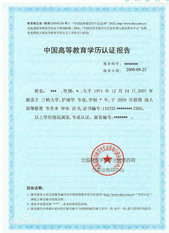
教育部学历认证报告照片示例