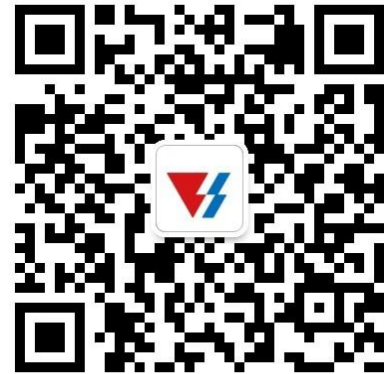
天能校园招聘“微信公众号”