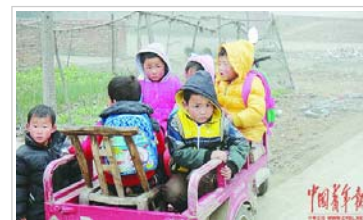
湖北小学踩踏事件4死7伤