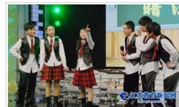
2011年江苏省中小学“校园心理剧”优秀剧目汇演及颁奖活动