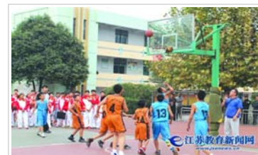
怎样才能破解学生体质下降之困？