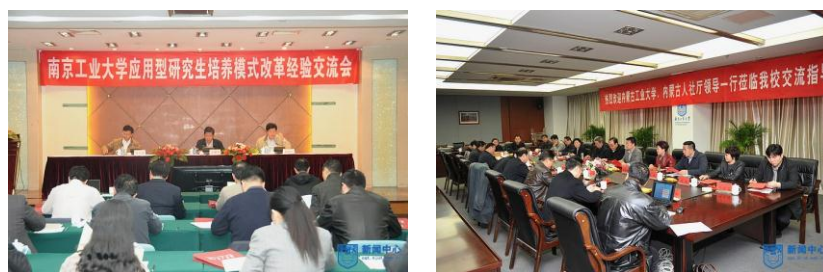
图 10：应用型研究生培养模式改革经验交流会和与兄弟院校交流

应用与评价三：培养经验广泛推广，改革成果受到普遍赞誉。 学校在材料工程领域、建筑与土木工程领域先行实施应用型研究生培养改革试点的基础上，将成功经验推广至全校19个工程硕士领域。扬州大学、南京工程学院、内蒙古工业大学、新疆昌吉学院等高校相继到学校借鉴交流，现已与淮阴工学院、盐城师范学院、盐城工学院等院校签订全日制工程硕士专业学位研究生联合培养计划，使改革经验得以向区域辐射。在我校应用型研究生培养模式改革经验交流会上，江苏省学位办主任、江苏省教育厅研究生教育处处长杨晓江对我校应用型人才培养模式改革寄予高度评价，认为我校的应用型研究生培养已经“办出特色、形成品牌”。