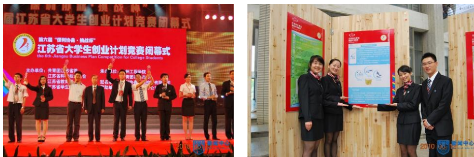
图 6：获第六届“挑战杯”江苏省大学生创业计划大赛特等奖

实施成效五：教学研究与改革成效显著。 2009年以来，团队在承担教育部和江苏省应用型研究生综合改革试点项目的同时，完成江苏省研究生教育改革与实践课题 25 项，发表了课程建设、培养模式改革、实践基地建设、研究生教育管理等 教学 研究论文 8 篇。