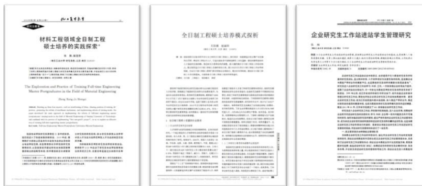
图 7：公开发表教学改革研究论文

实施成效五：教学研究与改革成效显著。 2009年以来，团队在承担教育部和江苏省应用型研究生综合改革试点项目的同时，完成江苏省研究生教育改革与实践课题 25 项，发表了课程建设、培养模式改革、实践基地建设、研究生教育管理等 教学 研究论文 8 篇。