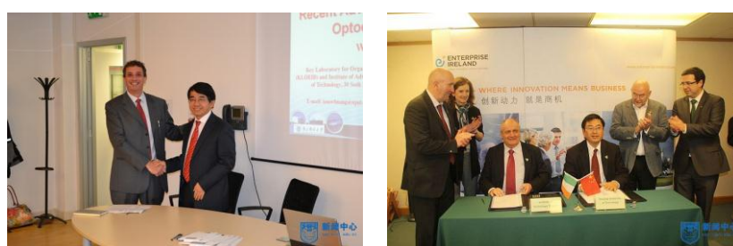
图12：与意大利纳米科学技术研究中心、爱尔兰塔拉理工学院合作签字仪式

应用与评价五：工程应用型研究生培养国际交流合作逐步推进。 与美国约翰霍普金斯大学、爱尔兰塔拉理工学院、沙特阿卜杜拉国王科技大学、意大利纳米科学技术研究中心、加拿大渥太华大学、美国伊利诺伊大学等10多所高校达成工程应用人才联合培养交流合作计划。工程应用型研究生培养成果，受到海外兄弟院校的赞赏。