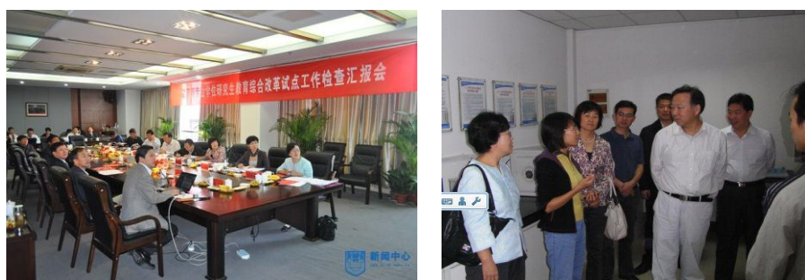
图 9：接受教育部专业学位研究生综合改革试点工作检查

应用与评价二：顺利通过教育部专业学位研究生教育综合改革试点项目检查验收。 2011年9月，受教育部学位管理与研究生教育司委托，由浙江大学党委常务副书记陈子辰担任组长的专家组，听取了我校专业学位综合改革试点项目中期汇报，并对我校材料工程领域研究生实践基地江苏博特新材料有限公司进行了实地检查。学校应用型人才培养模式改革的阶段性成果受到专家组的一致好评。2013年改试点项目顺利通过教育部专业学位研究生教育综合改革试点项目检查验收。