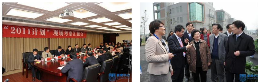
图 8：教育部“2011 计划”来我校实地考察

应用与评价一：受到教育部“2011计划”专家组肯定。 2013年3月22日，教育部“2011计划”专家组实地考察我校先进生物与化学制造协同创新中心。专家组一行听取了汇报，实地考察了中心平台、基地和载体，对我校寓教于研、寓教学科研与社会服务的 应用型研究生培养体系 给予肯定。