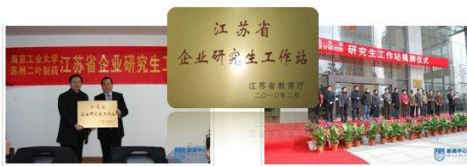
图 4：省级企业研究生工作站挂牌