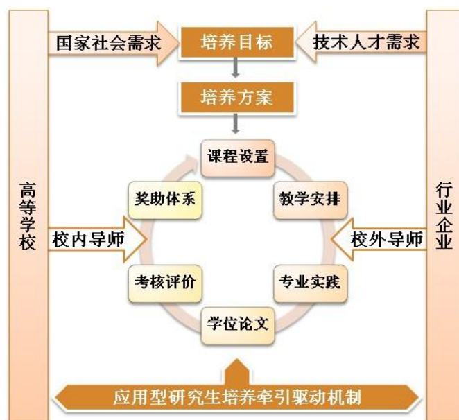
图 1：南京工业大学全日制工程硕士研究生校企协同培养体系

师、三个结合”的产学研用联合培养模式：校内学习与企业实践相结合，校内导师与校外导师相结合，技术研发与人才培养相结合。在企业提供的研发经费和生活条件的支持下，在校企“双导师”的指导下，以企业委托工程研发项目为依托，研究生深入企业研究生工作站、企业创新中心等载体，开展研发工作和学习生活，充分融入企业环境。校企双方建立了完善的管理制度，研究生进站时带着明确的课题任务，企业为研究生提供必要的研发条件，同时提供生活补贴、宿舍、食堂等生活条件。研究生进站实行自愿申请和遴选制度，出站时必须通过严格的出站考核。校企双方共同成立管理委员会，加强对工作站的运行管理。通过这种方式，一方面助推了企业的研发能力，另一方面提升了学生的实践能力和职业素养，取得学校和企业双赢的效果。