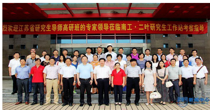
图 5：江苏省骨干研究生导师高级研修班成员考察我校研究生工作站

实施成效三：高水平导师队伍建设卓有成效，“双导师制”深入实施。 依托国家级教学团队，教育部“长江学者和创新团队发展计划”创新团队等培育高水平校内导师队伍的同时，学校吸收15名江苏产业教授和30多名海内外“三创领军人才”作为应用型研究生导师，同时聘请了200多名企业高级工程技术人才担任研究生校外导师，构建了一批具有明确专业方向、能与校内导师形成稳定导师组的校外导师队伍，实现分工协作，优势互补的“双导师”共同指导。学校在被确定为江苏省人才强校试点高校同时，2012年荣誉“江苏省教育人才工作先进单位”。